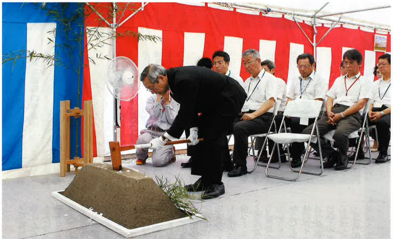
管理棟建設第一期工事及び 三陽ホーム増築工事安全祈願祭