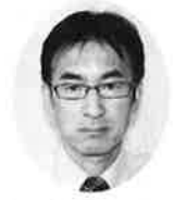
ハビリポート若葉若竹施設長