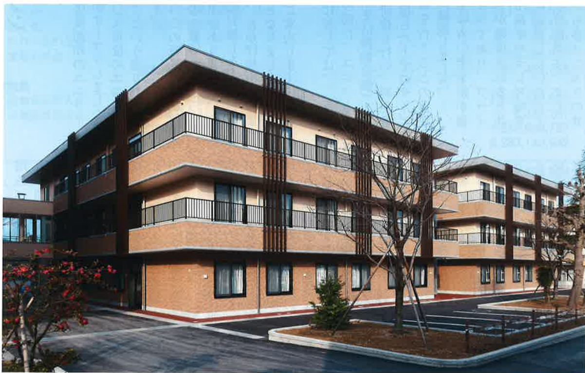
四月からオープンした陽風園初の ユニット型特別養護老人ホーム 万陽苑清風館