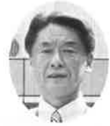
陽風園地域福祉プラザ