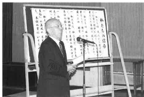
職員研修でのご様子