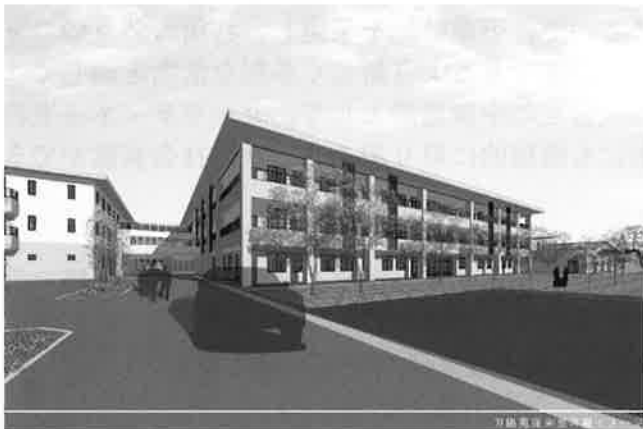
全室を個室とします！