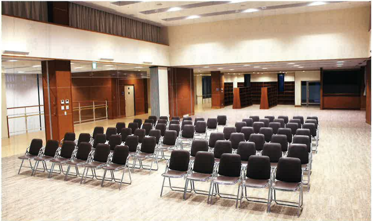
仁愛ホールから見た二階・図書コーナー

発行 社会福祉法人陽風園 金沢市三口新町1丁目8番1号 ☎ (076) 263-7101