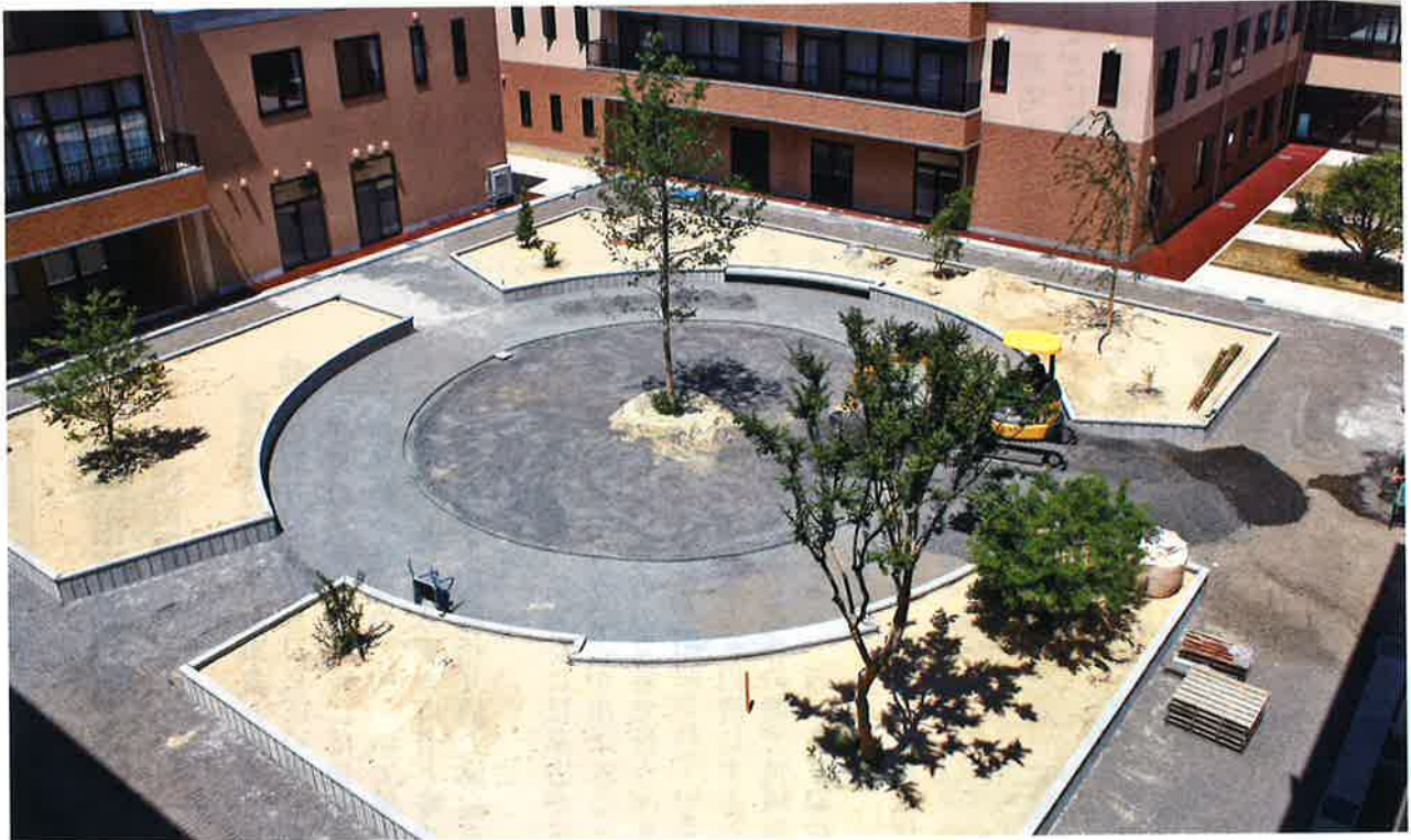
外構工事…スクエア（中庭）整備の様子

発行 社会福祉法人陽風園 金沢市三口新町1丁目8番1号 ☎ (076) 263-7101