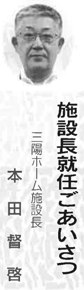
三陽ホーム施設長