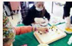
作って食べよう会 (デコレーションケーキ)