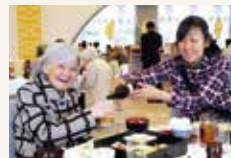
年忘れ会 カラオケ