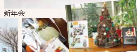
余技展 北陸学院大学短期 大学部収穫感謝祭訪問 石川県老人福祉施設 協議会長賞受賞

data 特別養護老人ホーム 第三万陽苑 □部屋タイプ：個室、多床室（2人） □空室：あり（3月22日現在） 〒920-1346 金沢市三小牛町24の3番地1 □定員：150名、ショートステイ20名 □見学・ご相談：076-280-6781