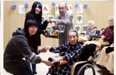
北陸学院大学短期大学部収穫感謝祭訪問