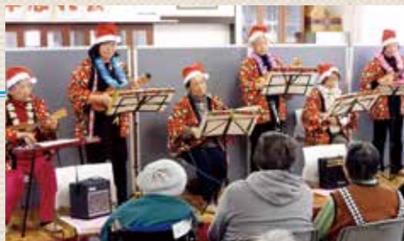
ウクレレ オバハンズ