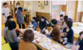
0歳児クラス 離乳食相談・試食会

0歳児クラスでは奇数月に離乳食相談も開催しています。次回は5月を予定していますが離乳食に興味のある方、悩みのある方はぜひいらして下さいね。