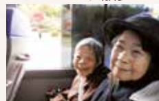
秋の紅葉ドライブ