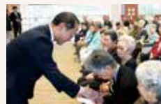
金沢市長歳末見舞