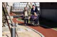
プロムナード散歩