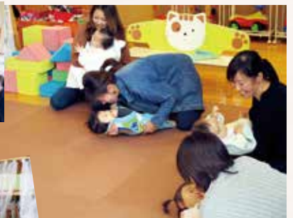
0歳児クラス ベビーマッサージ 親子で楽しく触れ合いました♪