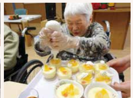
作って食べよう会