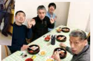
忘年会・握り寿司

data 就労継続支援B型 あけぼの作業所 □定員：40名 〒920-0944 金沢市三〇新町1丁目8番1号 □見学・ご相談：076-263-7694