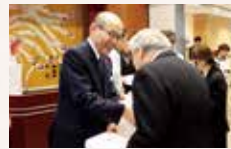
石川県知事歳末訪問