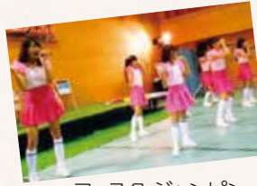
フェスタ・ジャンピン