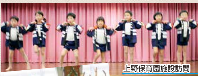
上野保育園施設訪問