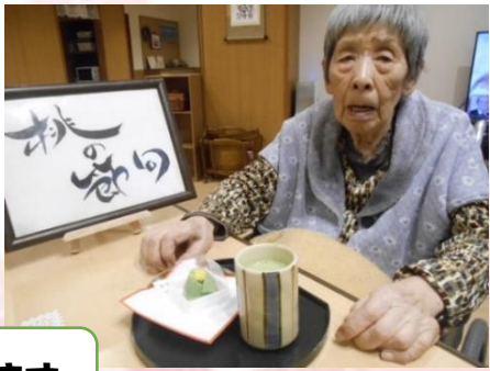
ひな祭り喫茶 上生菓子をいただきます