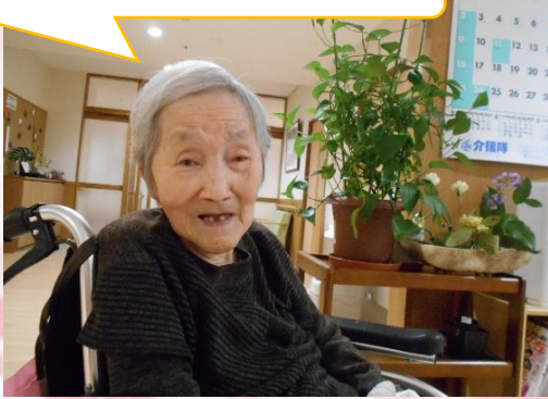
私の満面の笑みよ