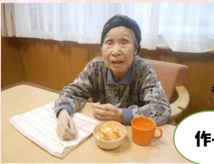
作って食べよう会 🍊