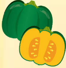
かぼちゃプリンを 作りました☆