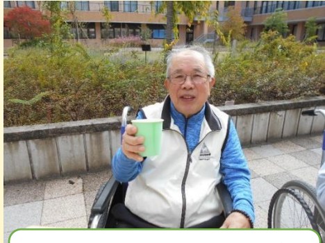
青空カフェの様子