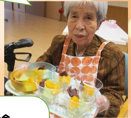
作って食べよう会 おいしいプリンを召し上がれ♪