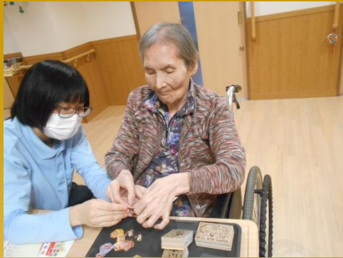
年賀状、真剣な表情です