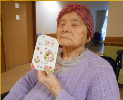
無事届きますように