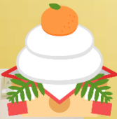
年忘れ会の様子 皆さん各々の年賀状を 作成しました