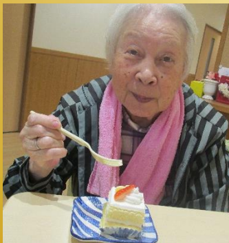
ケーキ、美味しいわ♪