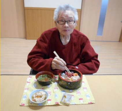
握り寿司もちらし寿司も好評でした