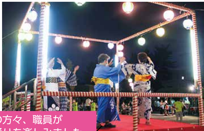
利用者様、地域の方々、職員が 一緒になって盆踊りを楽しみました