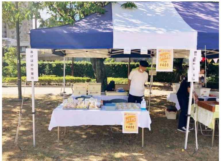
写真は9月の販売の様子

販売場所では、久しぶりに見かけたから寄ったという方や、初めてお越し下さった方々から消費者の声を聴く事ができ、生産者として非常に良い刺激となります。これらの方々に継続して購入していただくため、今後も良い商品づくりに励む所存です。