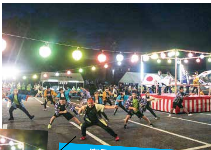
職員総勢40名での よさこいソーラン節は 迫力満点でした